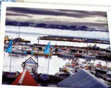
Húsavík, 2500 habitants, est un charmant petit port de la mer du Groenland. La vie économique du village, comme en Islande plus généralement d'ailleurs, tourne largement autour de la pêche.