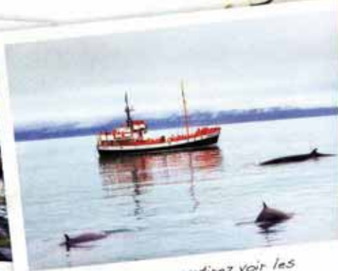
De ce port vous partirez voir les baleines tôt le matin pour une sortie de 3 h environ. Penser à réserver en juillet.